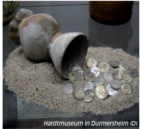
Hardtmuseum in Durmersheim (D)

Der PAMINA-Rheinpark ist ein wahres Paradies für Radler. Der integrierte deutsch-französische Radwanderweg «Rheinauen» hat eine Gesamtlänge von etwa 130 Kilometern und verläuft