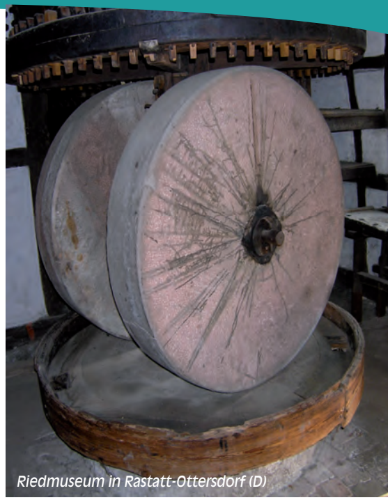
Riedmuseum in Rastatt-Ottersdorf (D)