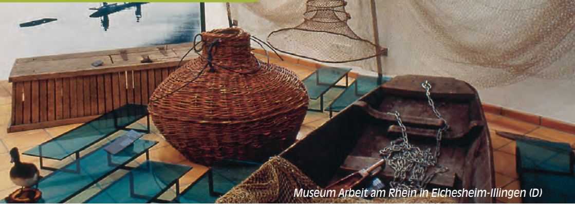
Museum Arbeit am Rhein in Elchesheim-Illingen (D)

60 Stationen , entlang der Routen sorgen für Abwechslung, laden zum Verweilen, Informieren ein und zeugen von landschaftstypischen Besonderheiten wie Streuobstwiesen, Kopf- und Silberweiden, Kräuterweihen, Aalschokker oder seltenen Pflanzen.