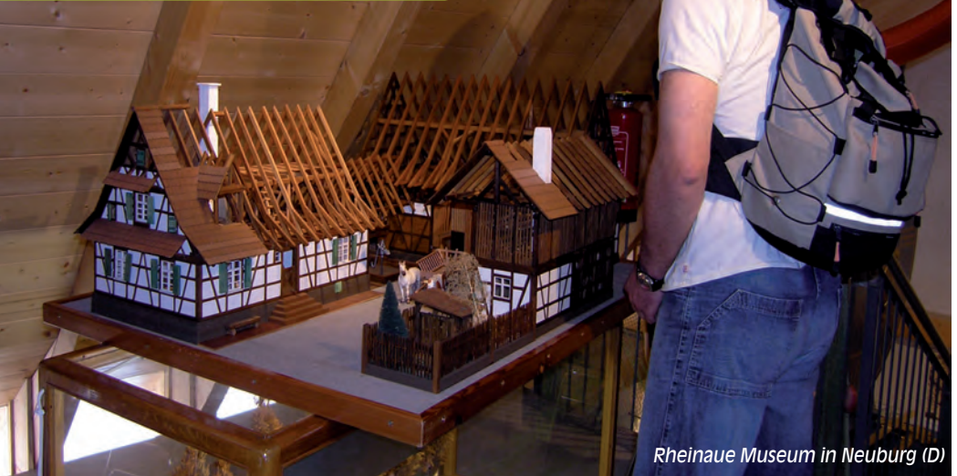
Rheinaue Museum in Neuburg (D)

Erlebnislandschaft an den Ufern des Rheins. Der PAMINA Rheinpark umfasst 34 badische, pfälzische und elsässische Städte und Gemeinden sowie die gesamte Oberrheinlandschaft zwischen Leimersheim / Eggenstein-Leopoldshafen und Lichtenau / Drusenheim (F) beidseits des Rheins.