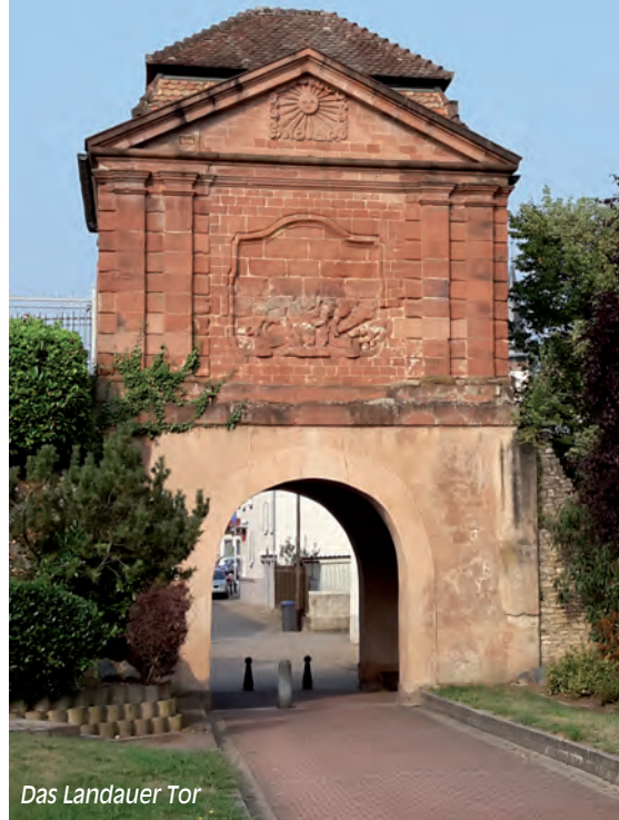
Das Landauer Tor

• Die Fischtreppe , in grüner Umgebung besteht aus 10 Becken und trägt zur Wiederherstellung des Ökosystems der Lauter bei, des (auf französischer Seite) 39 km langen Grenzflusses und Rheinzufusses.