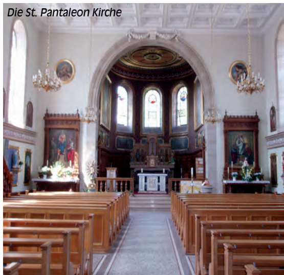
Die St. Pantaleon Kirche