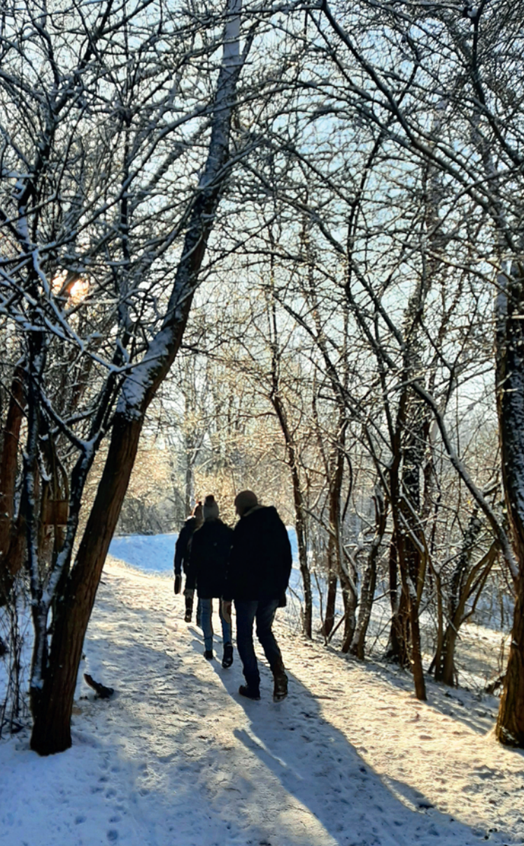
Winterwanderung mit einem Rheinpark-Guide Randonnée hivernale avec un guide-accompagnateur du Parc Rhénan